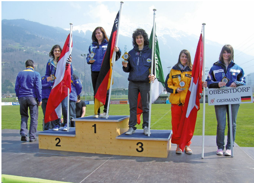
2010 Siegerehrung Schruns