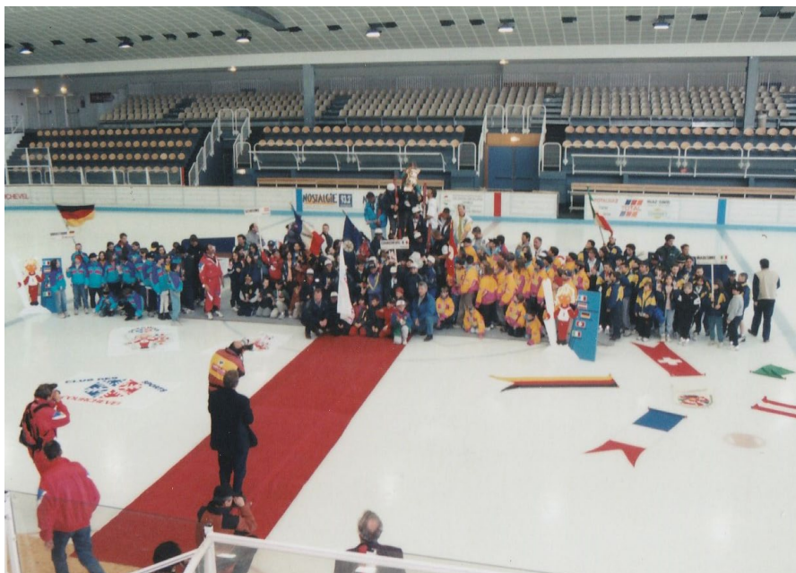
Gesamtfoto aller 5 Nationen in Courchevel