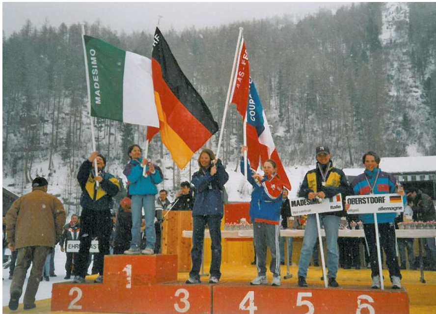
1998 Siegerehrung Saas-Fee