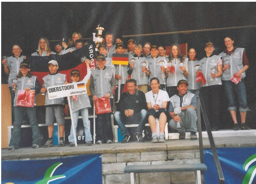
2004 Siegermannschaft Oberstdorf